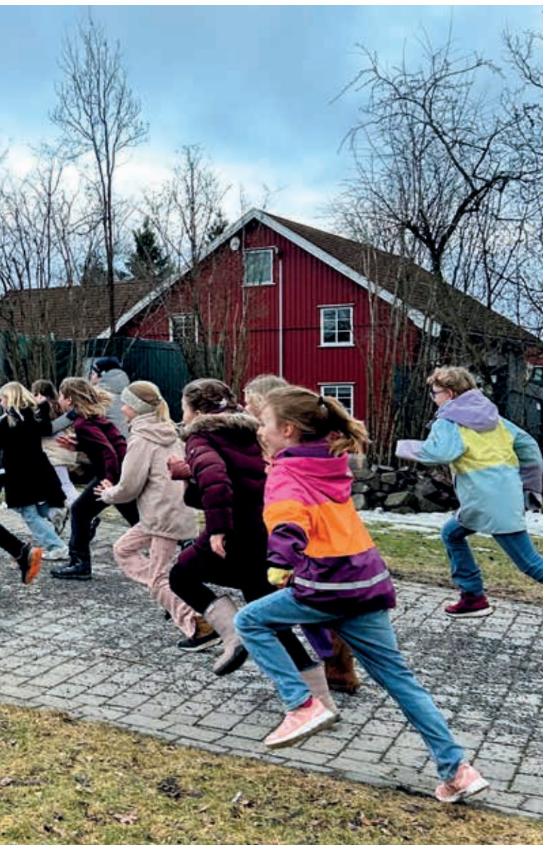
«agenthelg» i kirken. De løste oppgaver, lærte om kirkebygget, i kirketårnet (se forsiden).