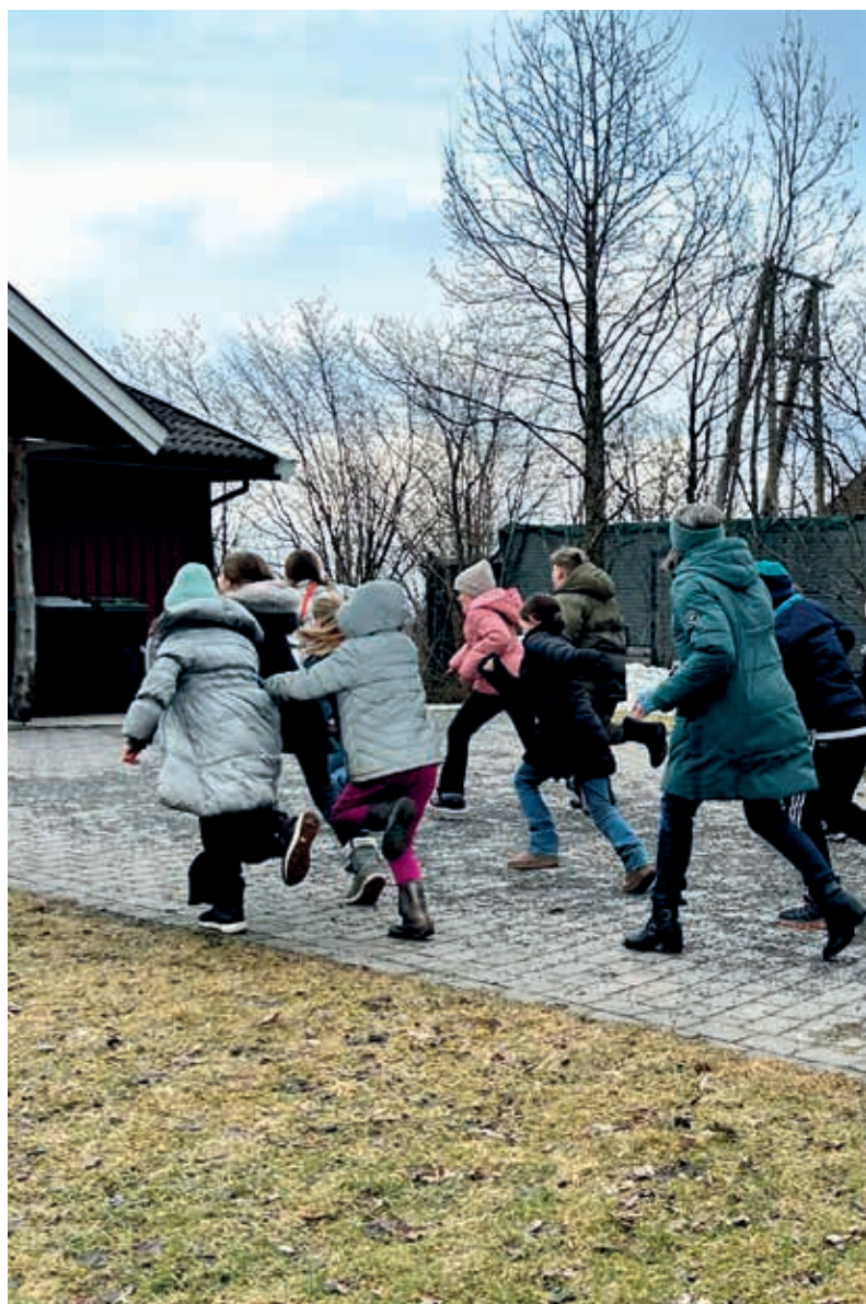
Tårnagenter er barn i alderen 8-9 år. I år var 26 barn samlet for en tradisjon og hemmelige gudstjenester. Alle våget seg også opp

Menighetsbladet regnes som uadressert informasjon og distribueres til alle husstander i menighetens område.