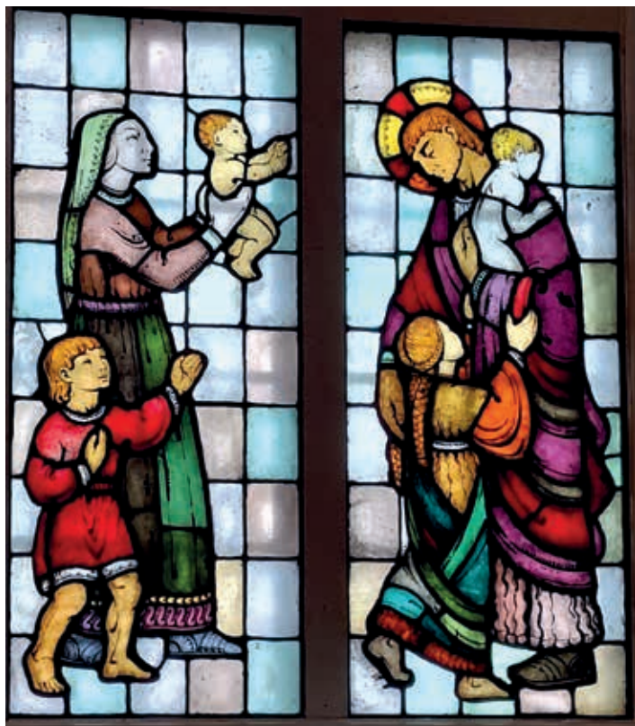
«La de små barn komme til meg». Glassmaleri i Holmestrand kirke.