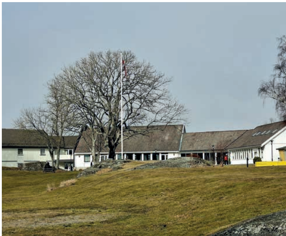
På Strand leirsted var 100 konfirmanter fra Botne, Sande og Hof samlet til leir i slutten av mars. Et godt sted å være.